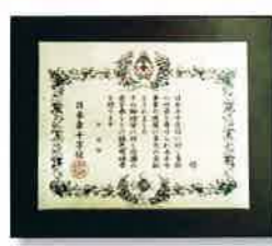
(個人:銀色有功章 法人:銀・金色有功章)