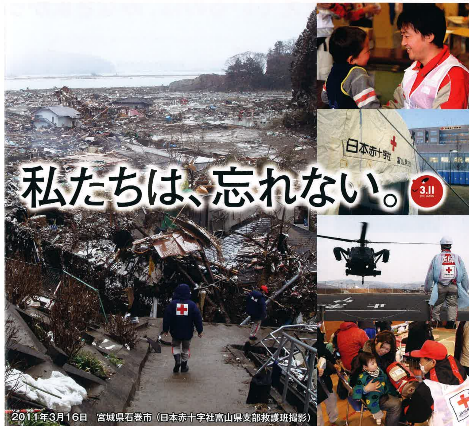
2011年3月16日 宮城県石巻市