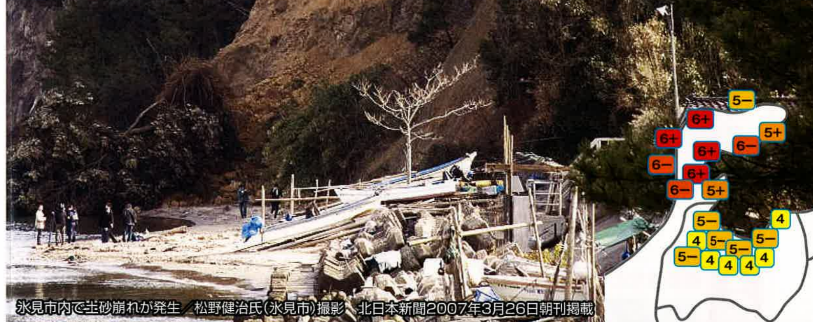
氷見市内で土砂崩れが発生 松野健治氏(氷見市)撮影 北日本新聞2007年3月26日朝刊掲載

富山県内では、富山市・滑川市・氷見市・小矢部市・射水市・舟橋村で震度5弱を観測しました。