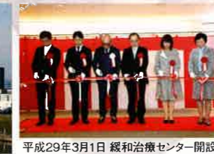
平成29年3月1日 緩和治療センター開設