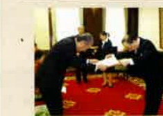
県庁特別室での伝達

(敬称略・平成28年4月1日から平成29年3月31日までに受章された方) ※受章された方のご意向を確認して掲載しています。