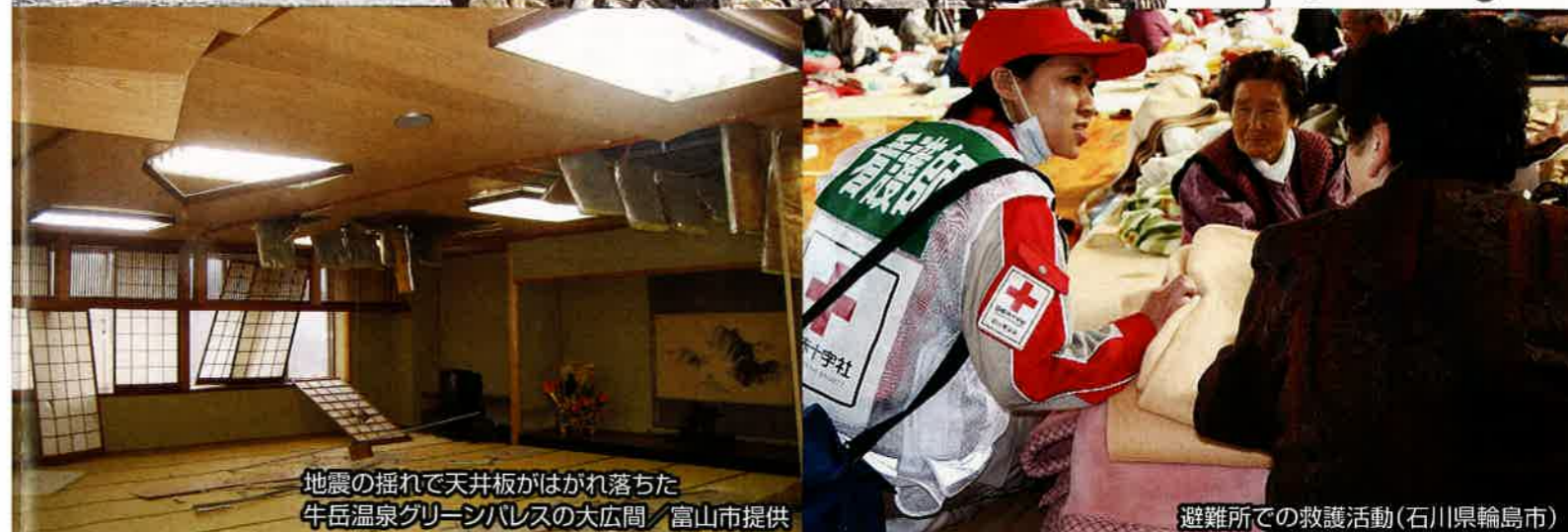
地震の揺れて天井板がはがれ落ちた 牛岳温泉グリーンパレスの大広間