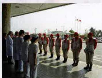
医療救護班出発式(富山赤十字病院前)