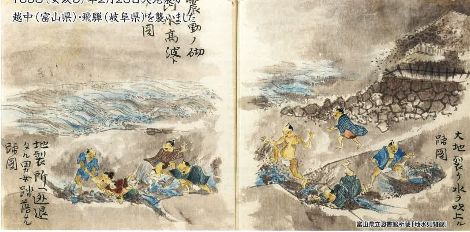
「地水見聞録」

1858(安政5)年2月26日大地震が越中(富山県)・飛騨(岐阜県)を襲った。高波、地裂、山崩れ、大津波、火災、大被害。震動、高波、地裂、山崩れ、大津波、火災、大被害。