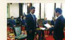
県庁特別室での伝達

(敬称略・平成29年4月1日から平成30年3月31日までに受章された方) ※受章された方のご意向を確認して掲載しています。