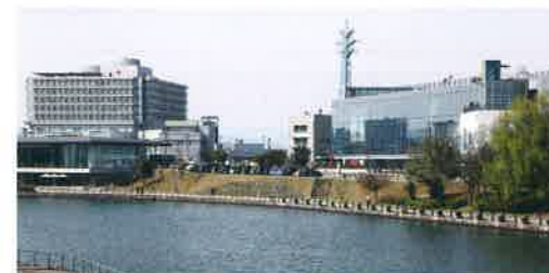
富山赤十字病院と平成29年に開館した富山県美術館