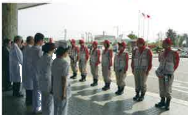
医療救護班出発式(富山赤十字病院前)